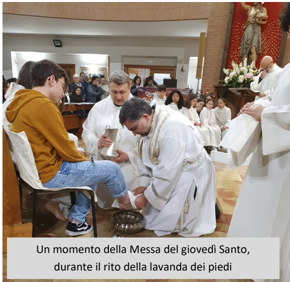
Un momento della Messa del giovedì Santo, durante il rito della lavanda dei piedi

Alla fonte battesimale quest'anno abbiamo voluto adornare l'altare della reposizione. Acqua viva che sgorga, fonte di grazia che sempre Dio ci dona, immersi in quell'acqua del battesimo ciascuno di noi entra a fare parte dell'albero della vita per giungere alla santità.