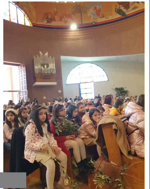
Benedizione delle Palme