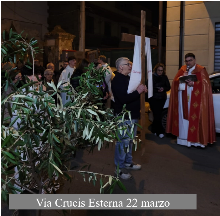
Via Crucis Esterna 22 marzo