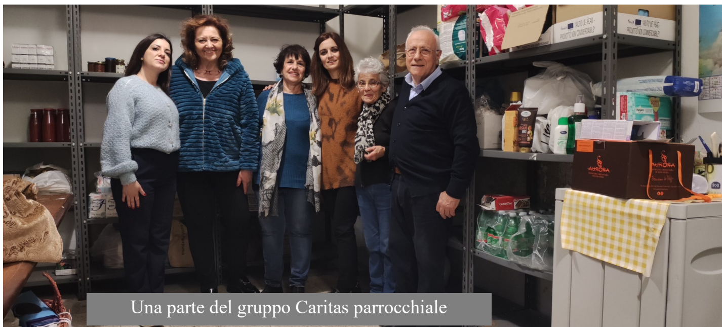
Una parte del gruppo Caritas parrocchiale