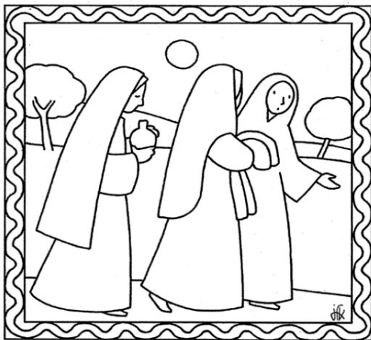
Vennero al sepolcro al levare del sole. Marco 16,2

Signore Gesù, crocifisso e risorto, apri i nostri occhi e accendi il nostro cuore, solo così potremo riconoscerti presente e vivo, lungo le strade percorse dall'umanità.